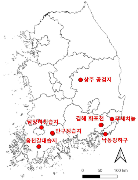
총 7개소(전남 3, 경남 2, 부산 1, 경북 1)