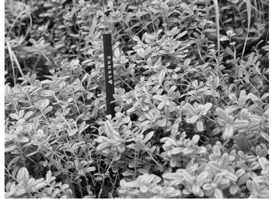
그림 1. 강원도 홍천의 월굴

월굴은 상록활엽성관목 또는 늘푸른작은떨기나무로, 키는 20cm를 넘지 않고 땅속뿌리가 길게 뻗는다. 잎은 어긋나고 딱딱하며 가죽질이고, 길이 1~3cm, 폭 5~13mm이고, 가죽처럼 뻗뻗하며 윤이 나고 달걀모양이며, 가을에 보라색으로 변한다(그림 1). 꽃은 6~7월에 지난해의 가지 끝에 2~3개씩 밑을 향하여 달리며 종 모양이고 흰색 또는 붉은 빛이 약간 띄는 흰색이다. 꽃의 길이 6~7mm이고 끝이 4개로 갈라지며 수술은 10개이며 수술대에 털이 있다. 열매는 과육과 액즙이 많고, 속에 씨가 들어 있는 과실인 장과(漿果)는 지름