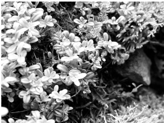
그림 5. 홍천군 풍혈의 월굴

( Sorbaria sorbifolia var. stellipila ), 박달나무( Betula schmidtii ), 귀룽나무( Prunus padus ), 진달래( Rhododendron mucronulatum ), 두메고사리( Diplazium sibiricum ), 민둥인가목( Rosa suavis ), 각시우드풀 또는 산우드풀( Woodsia subcordata ), 요강나물( Clematis fusca var. coreana ), 산새풀( Calamagrostis langsdorfii ), 집사초( Carex vaginata var. petersii ), 주저리고사리( Dryopteris fragrans ) 등 아고산대에 자라는 식물들이 나타난다. 바위 위와 토양이 있는 곳에 솔이끼( Polytrichum commune ), 지의류, 고사리류가 섞여 자란다. 이 가운데 두메고사리와 인둥인가목은 일본에서도 풍혈에서 자주 나타나는 종이다(Iokawa & Ishizawa, 2003). Nekola(1999)와 Iokawa & Ishizawa(2003)는 풍혈의 한대성식물이 격리 분포하는 것이 빙하기 이후 오래된 피난처(palaeo-refugia)에 국소적인 기후지대에 살아남은 잔존식물로 보았다.