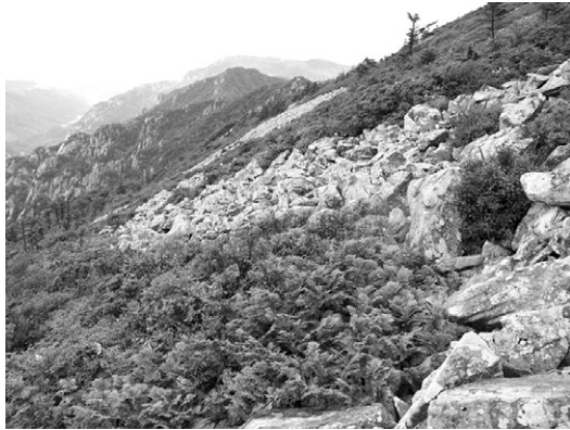
그림 4. 설악산 귀때기청봉 일대 아고산대 경관

( Silene oliganthella ), 바람꽃( Anemone narcissiflora ), 만주송이풀( Pedicularis mansburica ), 등대시호( Bupleurum euphorbioides ), 바람꽃( Anemone narcissiflora ), 흰인가목( Rosa koreana ), 붉은인가목( Rosa marretii ), 기생꽃( Trientalis europaea ), 솔나리( Lilium cernuum ), 난쟁이붓꽃( Iris uniflora var. carina ) 등 80여종의 북방계 식물이 산 정상부를 중심으로 분포한다(그림 4).